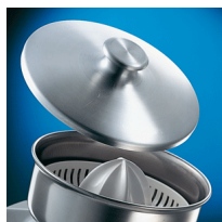
Coperchio - opzionale